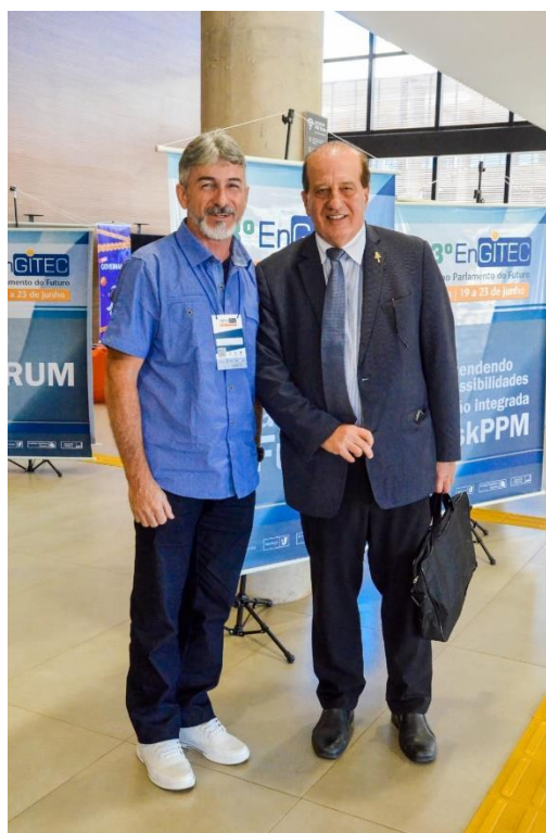
Com o Ministro Augusto Nardes do TCU