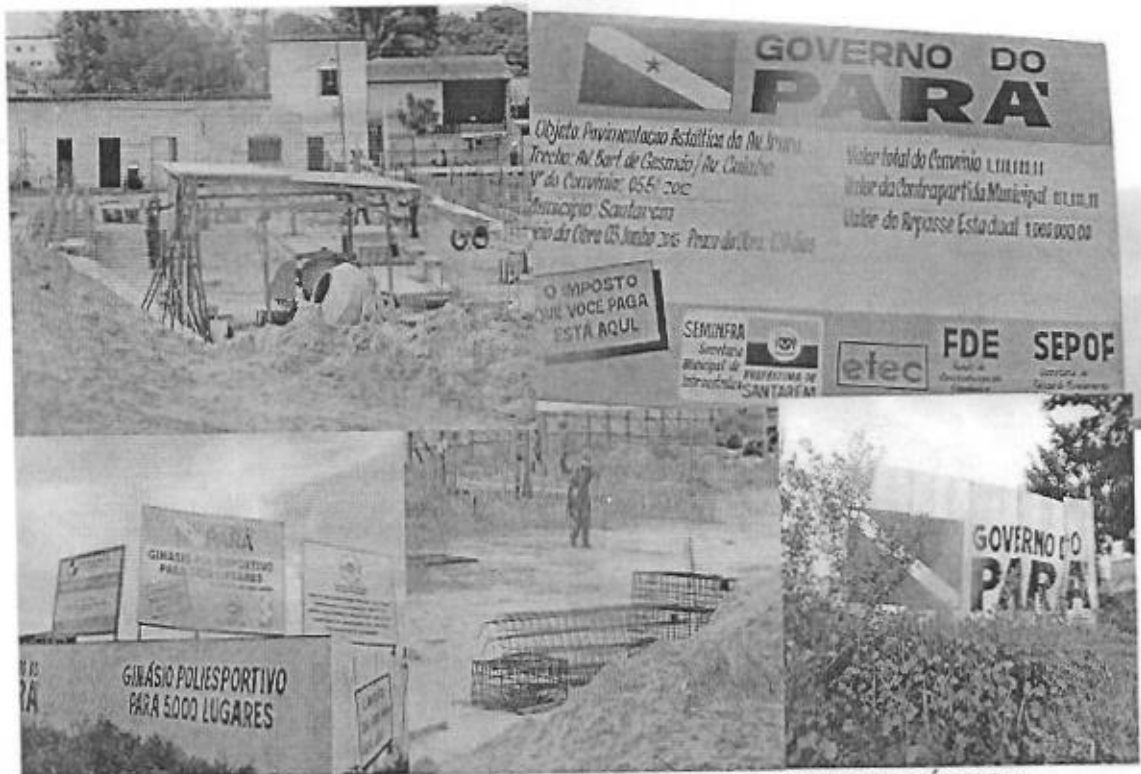
GINÁSIO POLIESPORTIVO NO CAMPO DO AMÉRICA valor da obra RS- 1.000.000,00