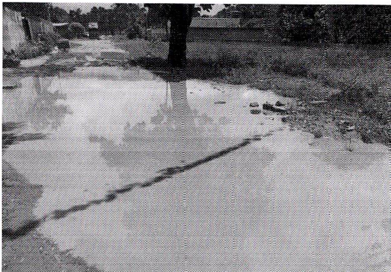
ELIELTON LIRA Vereador - AVANTE