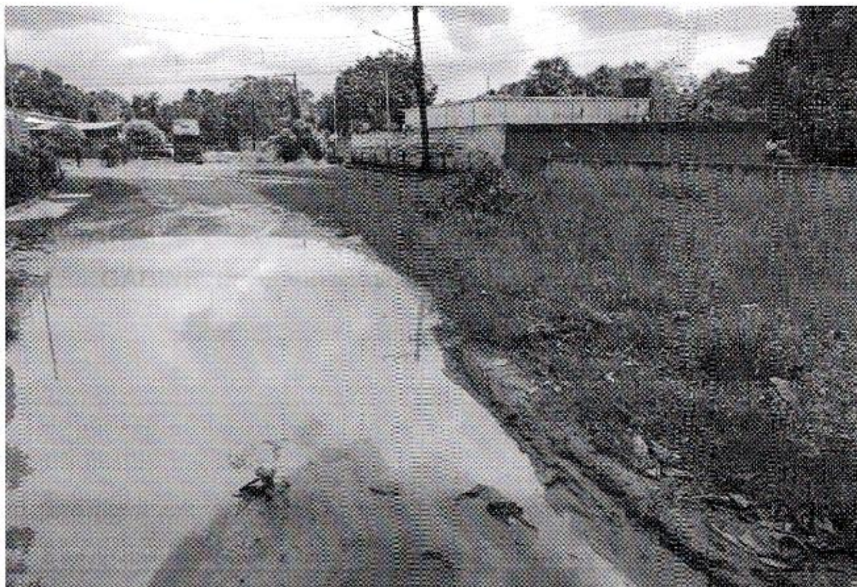
ELIELTON LIRA Vereador - AVANTE