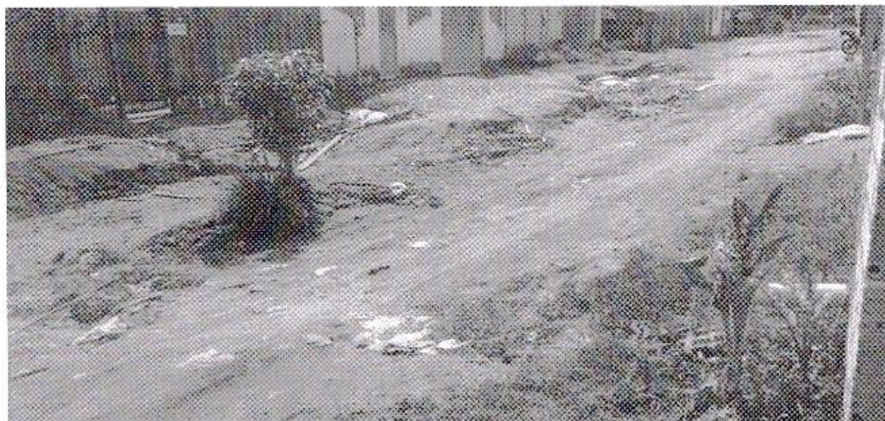
ELIELTON LIRA Vereador - AVANTE