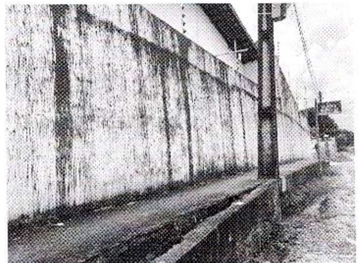
ELIELTON LIRA Vereador - AVANTE