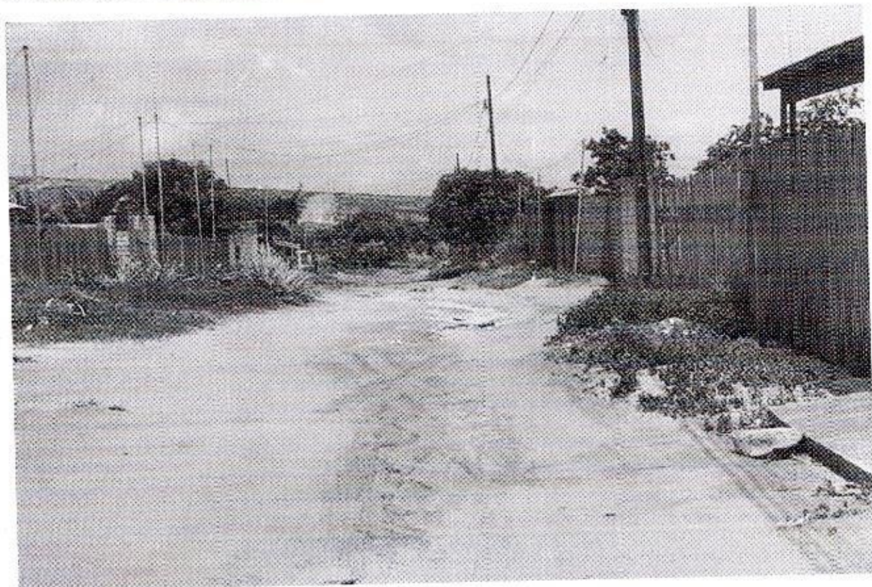
ELIELTON LIRA Vereador - AVANTE