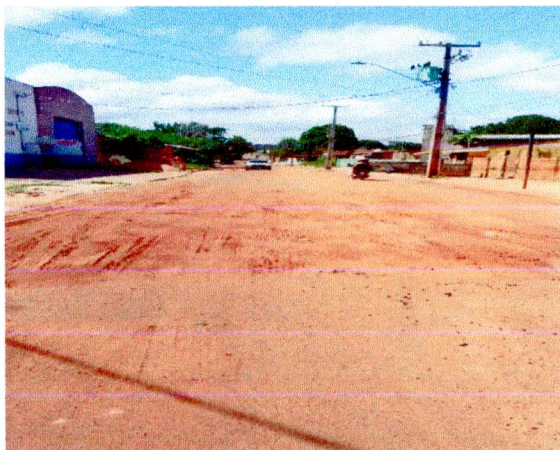
FOTO DO PERÍMETRO